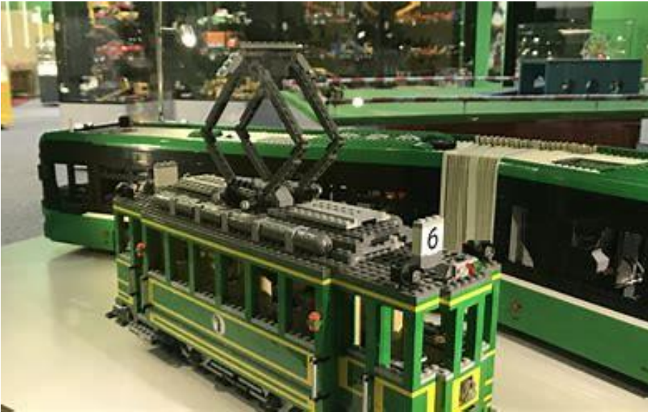
Le - brick - go Lego Museum Binningen